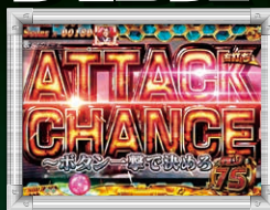
タイトル色: デフォルト