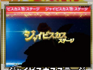
ジャイビスカスステージ