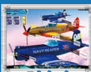
スカイハイ ステージ