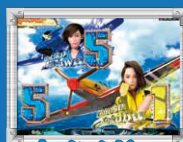
オーシャンビュー ステージ