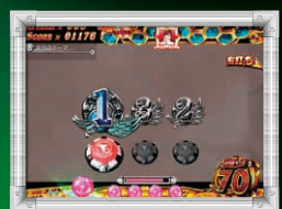
ボタン上の種類: 数字