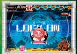
ターゲットの色: 青