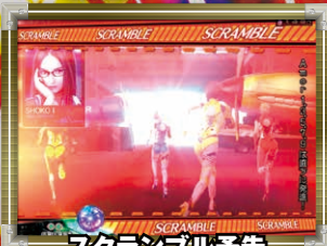
スクランブル予告