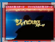
ジャイビスカス ステージ