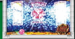
エフェクトの色: 青